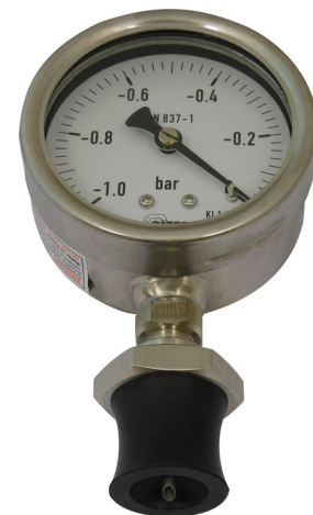
Raccord perforateur réf. 401 811 + mano 468 000